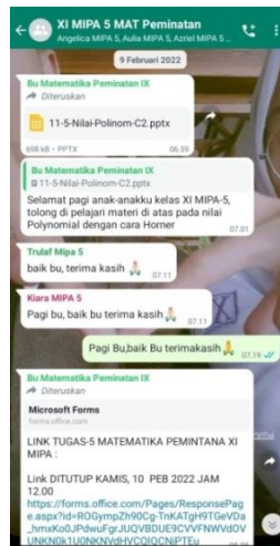
Gambar 1. Guru Mengirim Powerpoint

Guru memberikan modul, powerpoint , dan video untuk siswa mempelajari. Siswa harus mempelajari materi yang diberikan guru lewat media whatsapp dengan baik dengan begitu siswa dapat memahami dan mengerjakan soal dengan baik. Penggunaan media merupakan salah satu upaya guru dalam meningkatkan kedisiplinan selama pembelajaran daring matematika. Selama pembelajaran daring matematika menggunakan media whatsapp semua siswa dapat mengikuti pembelajaran daring matematika dan dapat menyimpan file pembelajaran yang diberikan guru untuk dipelajari secara berulang. Penggunaan media powerpoint juga dapat meningkatkan kedisiplinan siswa dalam pembelajaran. Penggunaan media powerpoint interaktif berdampak positif pada siswa yang kurang disiplin dalam pembelajaran karena melalui media powerpoint interaktif yang dibuat menarik dapat meningkatkan semangat siswa dalam disiplin belajar (Pambudi et al., 2021).