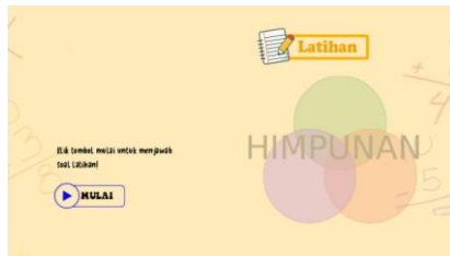
Gambar 7. Halaman Evaluasi