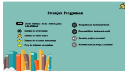
Gambar 8. Halaman Petunjuk Penggunaan

Pada tahap development, fokusnya adalah membuat struktur media pembelajaran dan instrument yang sebelumnya telah dirancang. Langkah selanjutnya adalah evaluasi oleh ahli media, bahasa dan materi. Evaluasi ahli dilakukan dengan menggunakan lembar penilaian yang mencakup beberapa indikator. Untuk ahli materi dievaluasi oleh Guru dan Dosen matematika, ahli media dievaluasi oleh instruktur Dosen Sistem Informasi, sedangkan evaluasi ahli bahasa dilakukan oleh Dosen Pendidikan Bahasa dan Sastra Indonesia. Dari hasil evaluasi,, dipaparkan rangkuman hasil rekapitulasi penilaian pada Tabel 3 berikut .