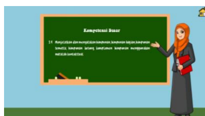
Gambar 4. Halaman Kompetensi