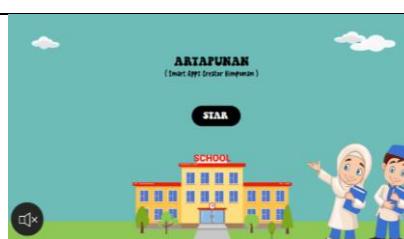
Gambar2. Halaman Pembuka