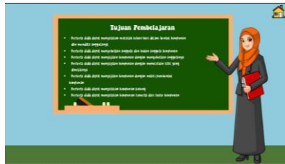
Gambar 5. Halaman Tujuan Pembelajaran