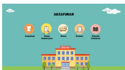
Gambar 3. Halaman Utama